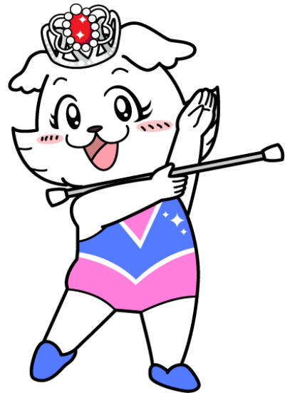
キャプテンわん・アンちゃん (C) ゆず華・(財) 横浜市体育協会